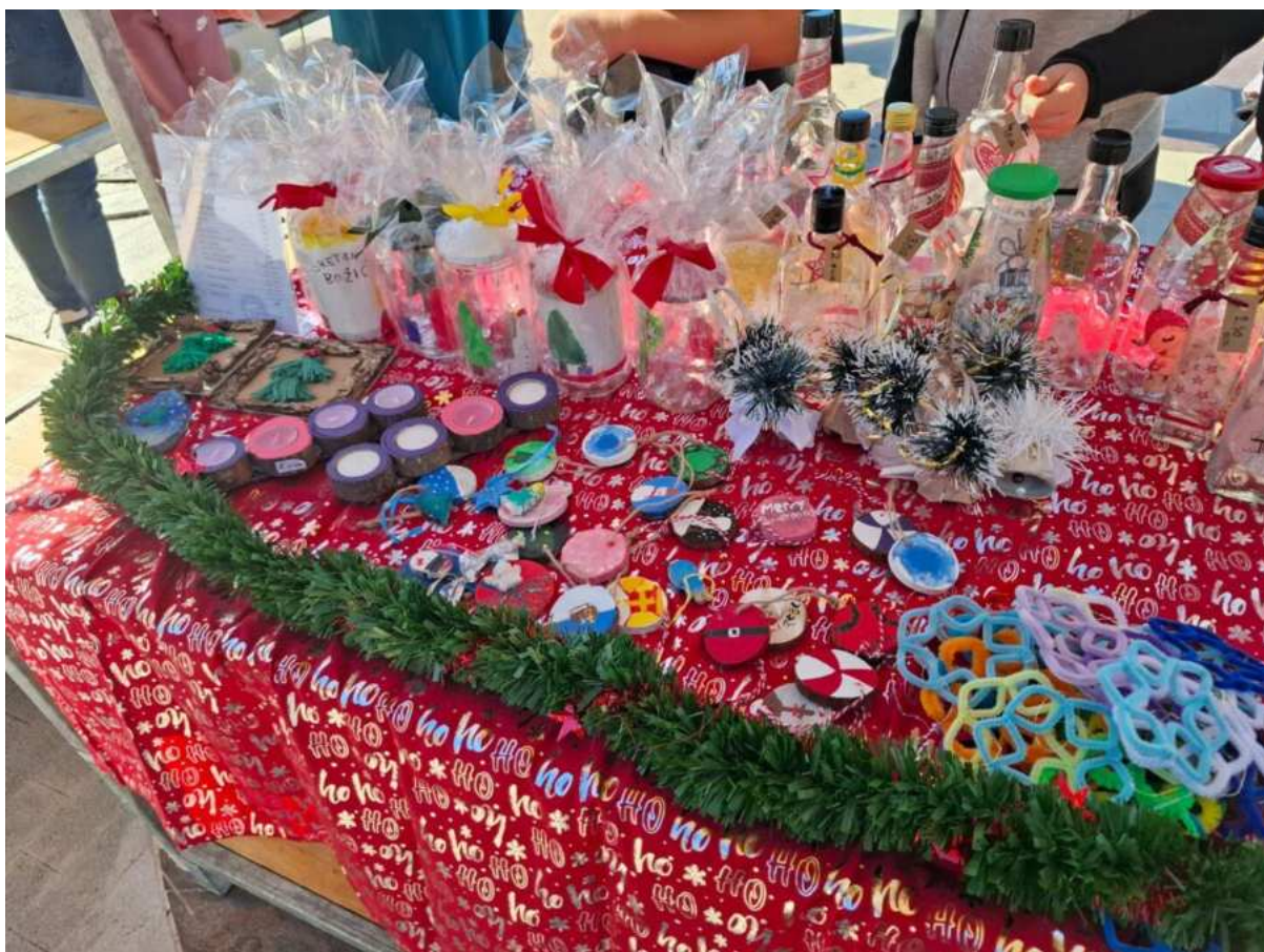
Naši učenci šire blagdanski duh kroz rukotvorine koje stvaraju s ljubavlju.